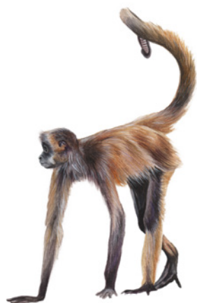
Mono Araña ( Ateles geoffroyi ) Sál ök / Sal