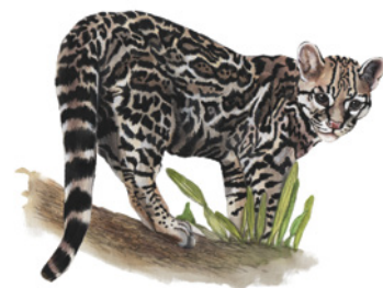
Caucel ( Leopardus wiedii ) Namú / Ajkö name