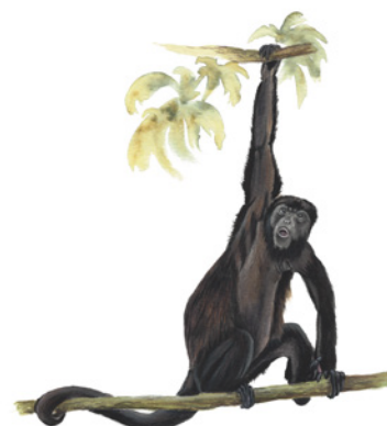
Mono Congo ( Alouatta palliata ) Win / Win