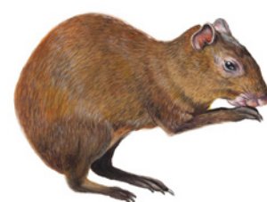
Guatusa ( Dasyprocta punctata ) Shulé / Shulé