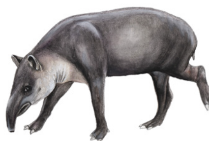
Danta ( Tapirus bairdii ) Naik / Nai'