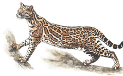
Manigordo ( Leopardus pardalis ) Namú