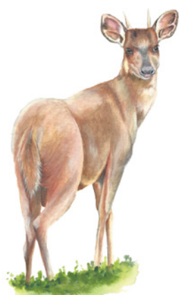
Cabro de Monte ( Mazama temama ) Kañik sulila / kál sulí