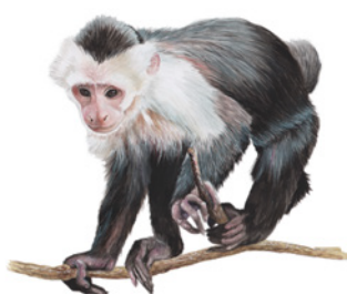
Mono Cara Blanca ( Cebus imitador ) Ök