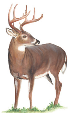
Venado Cola Blanca ( Odocoileus virginianus ) Sulila melëk surürü / Té sulí