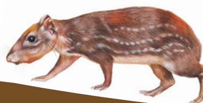
Tepezcuintle ( Cuniculus paca ) Könö / Kaṇo'