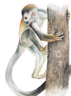
Mono Titi ( Saimiri oerstedii ) Tsáklö / Tsak