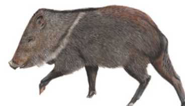
Pecarí de Collar ( Pecari tajacu ) Kasir / kàsir