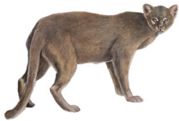
Yaguarundí ( Puma yagouaroundi ) Namú