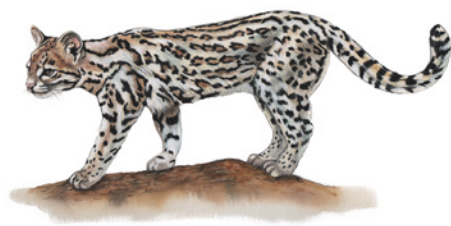
Tigrillo ( Leopardus trigrinus ) Namú / Dakaró name