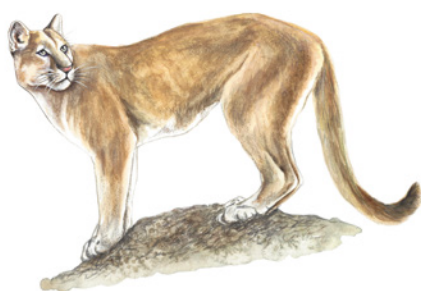
Puma ( Puma concolor ) Namú / Dakölum